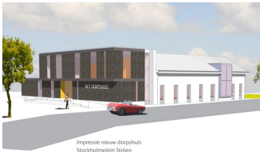
Impressie nieuw dorps huis Stockholmplein Strijen

aan de overzijde van het dorps huis is een scheidingwand aangebracht, waardoor enkele activiteiten tijdelijk kunnen verhuizen naar de bibliotheek.